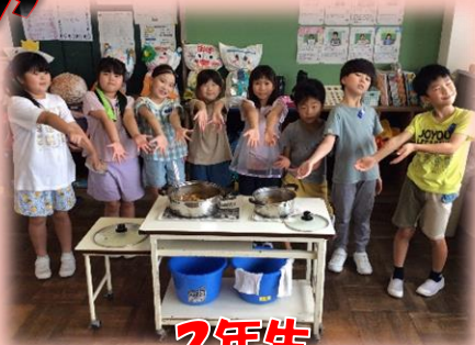
2年生 カレーパーティー

2年生が学校園で栽培している野菜が、たくさん実りました。収穫を祝って、カレーパーティーを行いました。夏野菜をふんだんに使ったカレーをみんなで作ったり味わったりしました。天気の良い日に忘れず水かけを行った成果ですね。