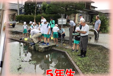
5年生 二の堀水質調査

4年生が春に種をまいた紅花が、きれいに花を咲かせました。そこで、紅花を収穫し、紅花を使ってできる活動を行おうと計画しました。また、季節の風物詩として各教室に飾ってもらおうと、各学年へプレゼントしました。これからの活動も楽しみです。