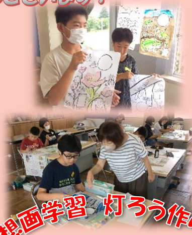
想画学習 灯ろう作り！

150周年記念として「紅花150本きれいに咲かせます」に取り組んだ4年生。半夏生の日に1輪咲いた後、次々にきれいな花を咲かせ、その数なんと300本以上！春から畑作り、水かけ、草取りなどのお世話をしてきた成果です。きれいな紅花が学校中に飾られ、見る人の目を楽しませてくれました。次は、紅花染めにチャレンジです。