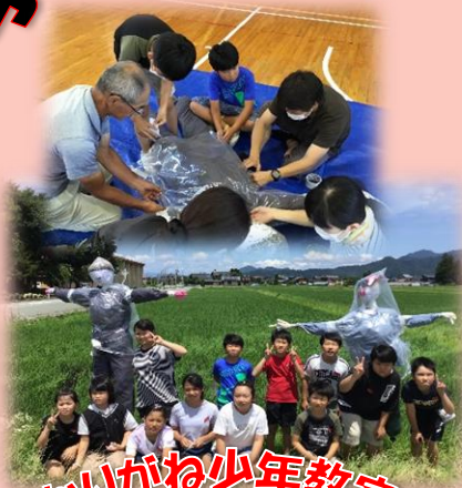
かがね少年教室 かかし作り

5年生が、かがね少年教室でかかし作りを行いました。地域の方から、かかしの由来や作り方を教わり、班に分かれて製作開始。保護者の方々のご協力もあり、2体の個性なかかしが完成しました。稲もぐんぐん伸びています。2体のかかしが今日も稲を見守っています。