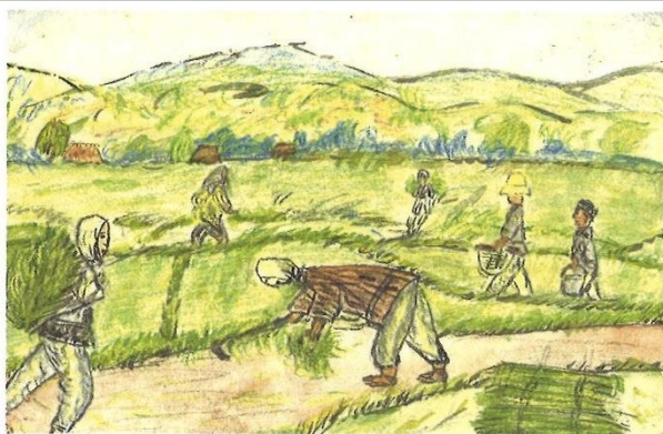
「草刈り」 堀江敬三 高1 (56)

今年度も画文集『昭和の記憶』を中心に、想画の記憶をたどります。6年生による心に響いた想画の感想を届けます。